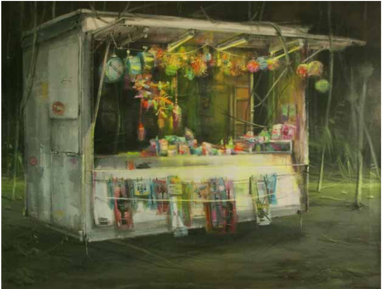
LETICIA GASPAR, Ilusión , 2016. Acrílico sobre tela. 100 x 130 cm