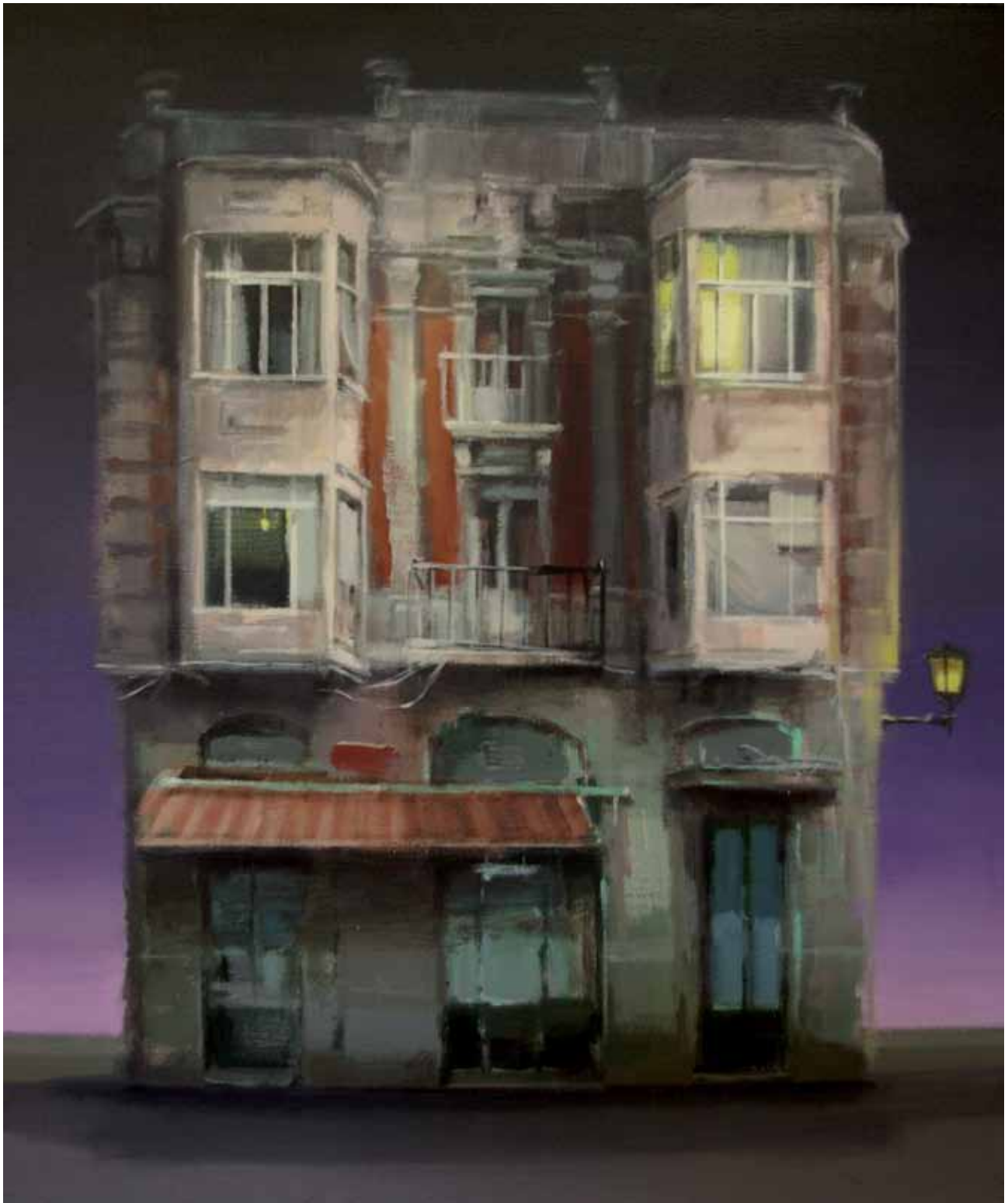
LETICIA GASPAR, ST , 2016. Acrílic sobre tela. 64 x 54 cm