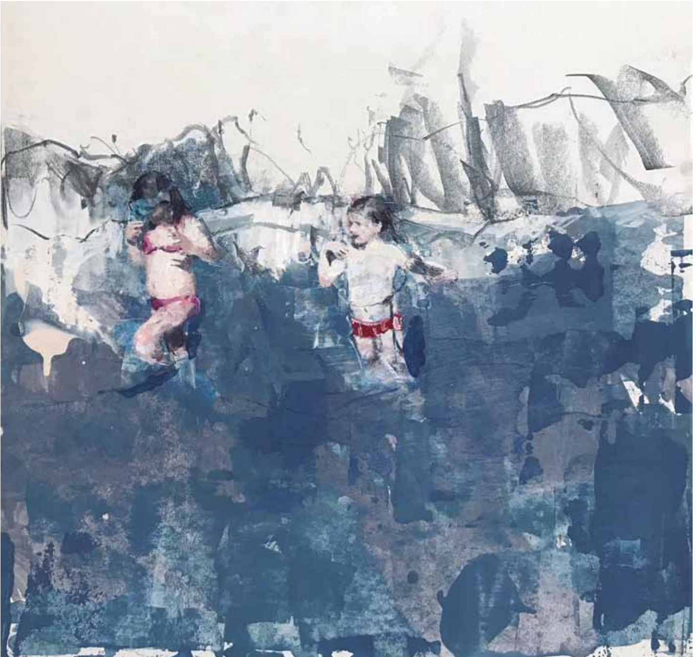
MARTA LAFUENTE, 2018. Tiny Lives. Scene 4 . Tècnica mixta sobre cartró encolat en tauler. 44 x 44 cm