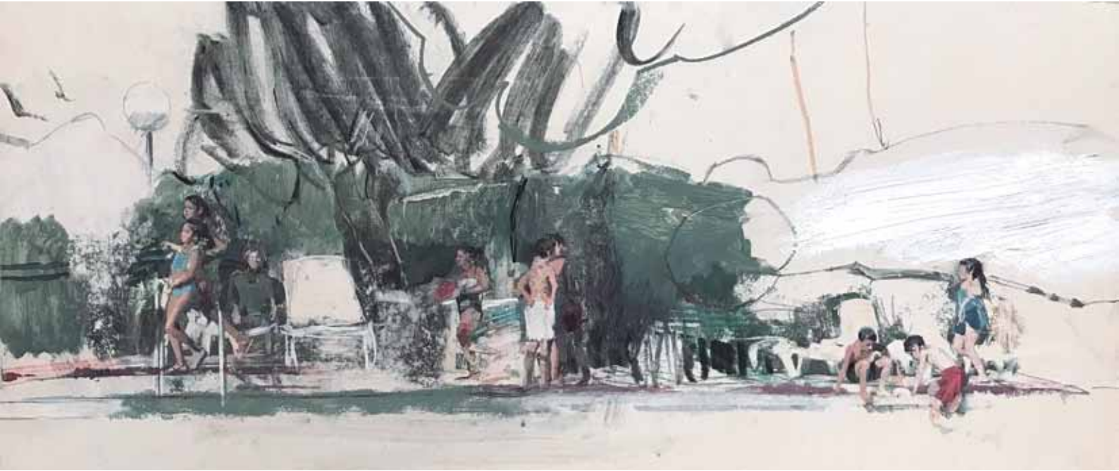
MARTA LAFUENTE, 2018. Tiny Lives. Scene 3 . Tècnica mixta sobre cartró encolat en tauler. 32 x 75 cm