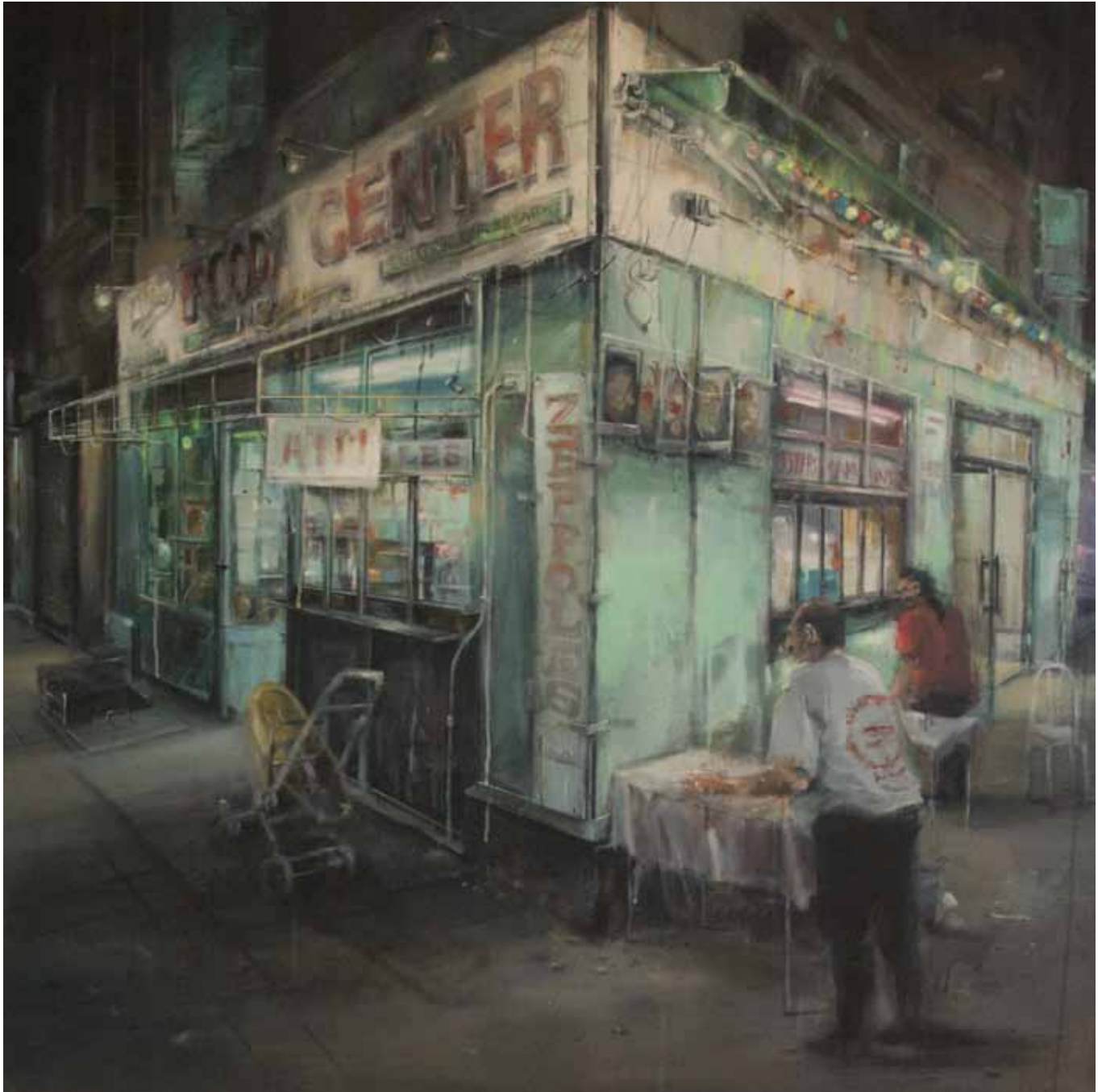
LETICIA GASPAR, Fast living , 2016. Acrílic sobre tela. 120 x 120 cm