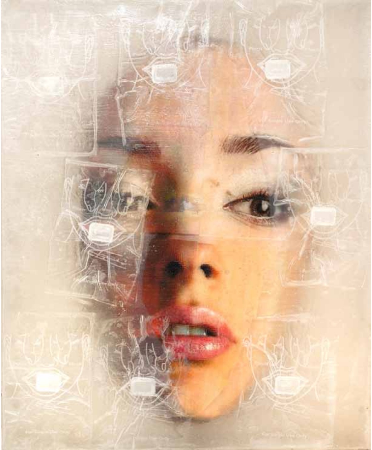
LIU GUANGYUN, Serie Surfaces , 2011. Tècnica mixta. 100 x 80 x 15 cm