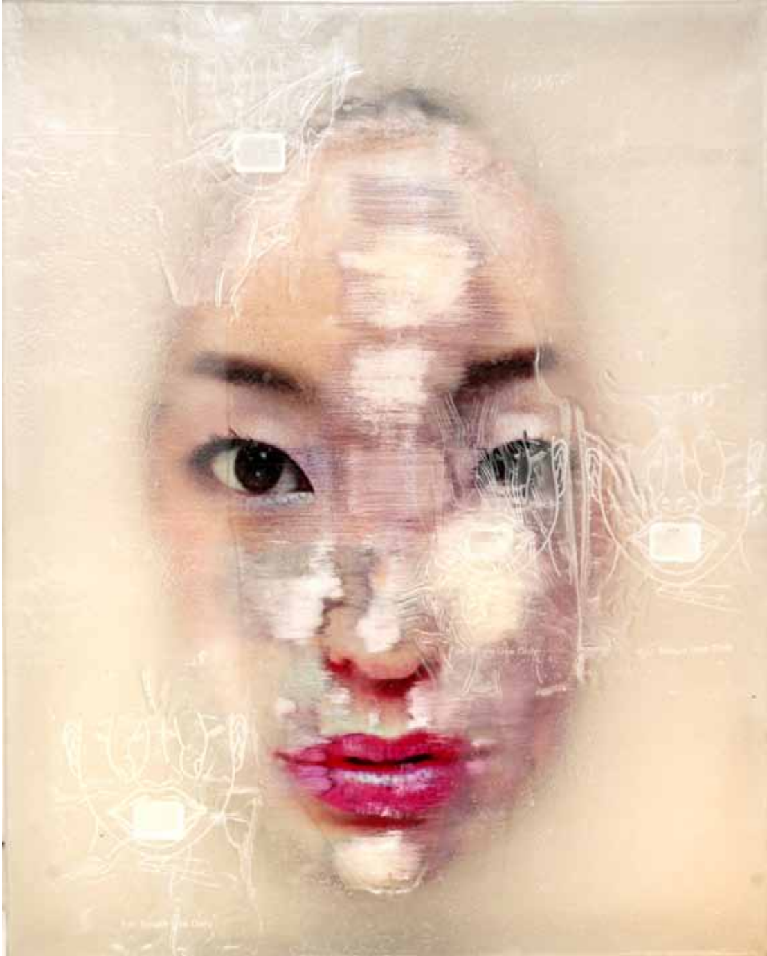
LIU GUANGYUN, Serie Surfaces , 2011. Tècnica mixta. 100 x 80 x 15 cm