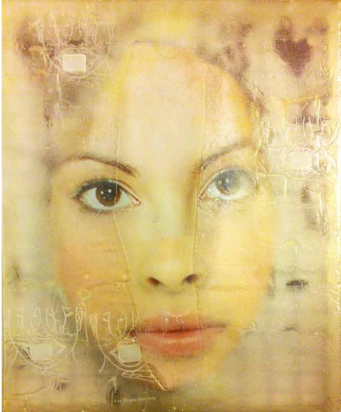
LIU GUANGYUN, Serie Surfaces , 2011. Tècnica mixta. 100 x 80 x 15 cm