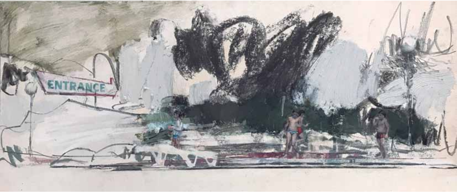
MARTA LAFUENTE, 2018. Tiny Lifes. Scene 1 . Tècnica mixta sobre cartró encolat en tauler. 32 x 75 cm