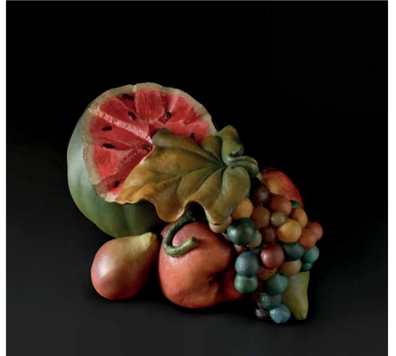
Caravaggio Discount, 2017 Resina policromada a mano 12 x 27 x 20 cm Ed. 1/5