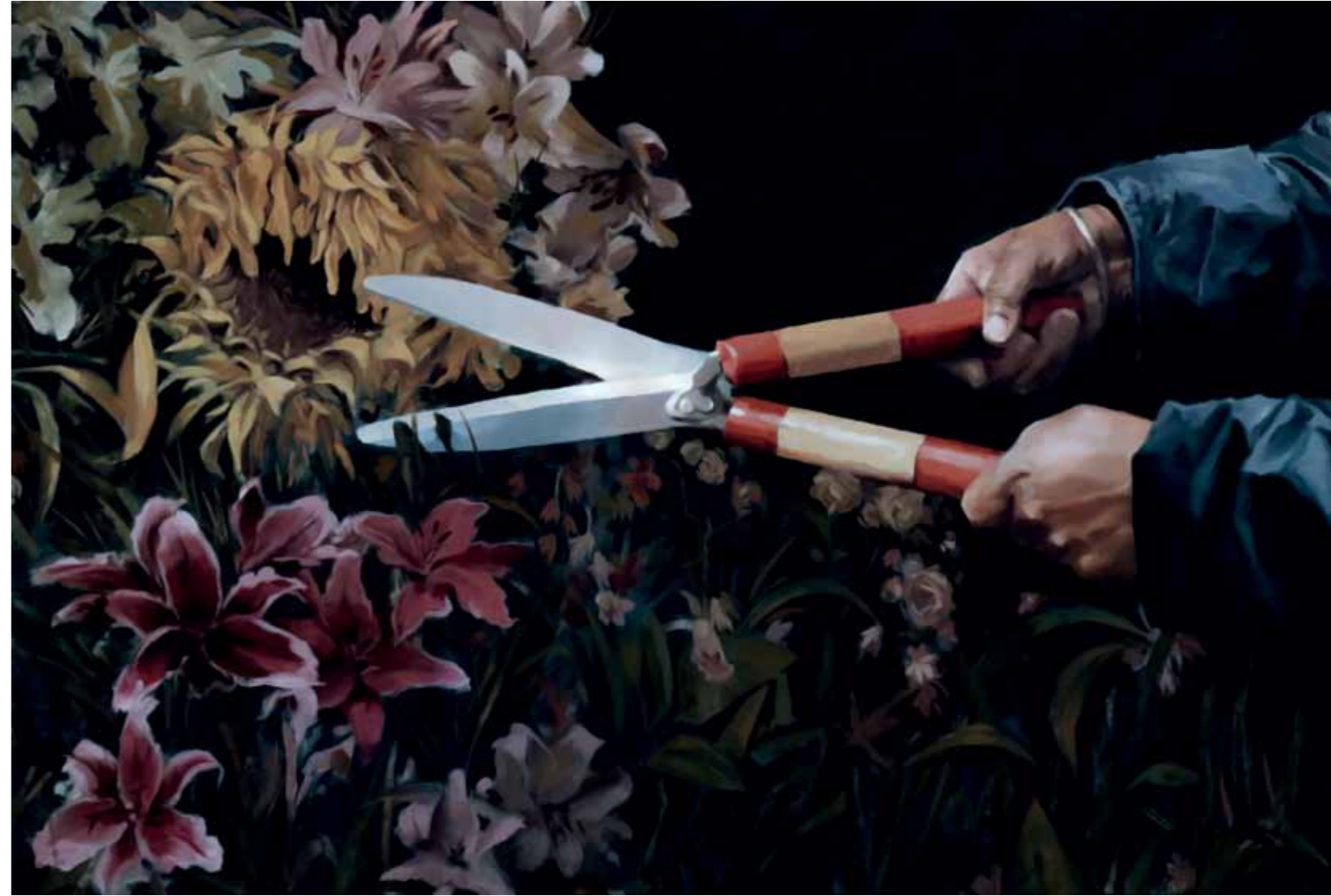
Primavera, 2017 Óleo sobre tela 54 x 81 cm