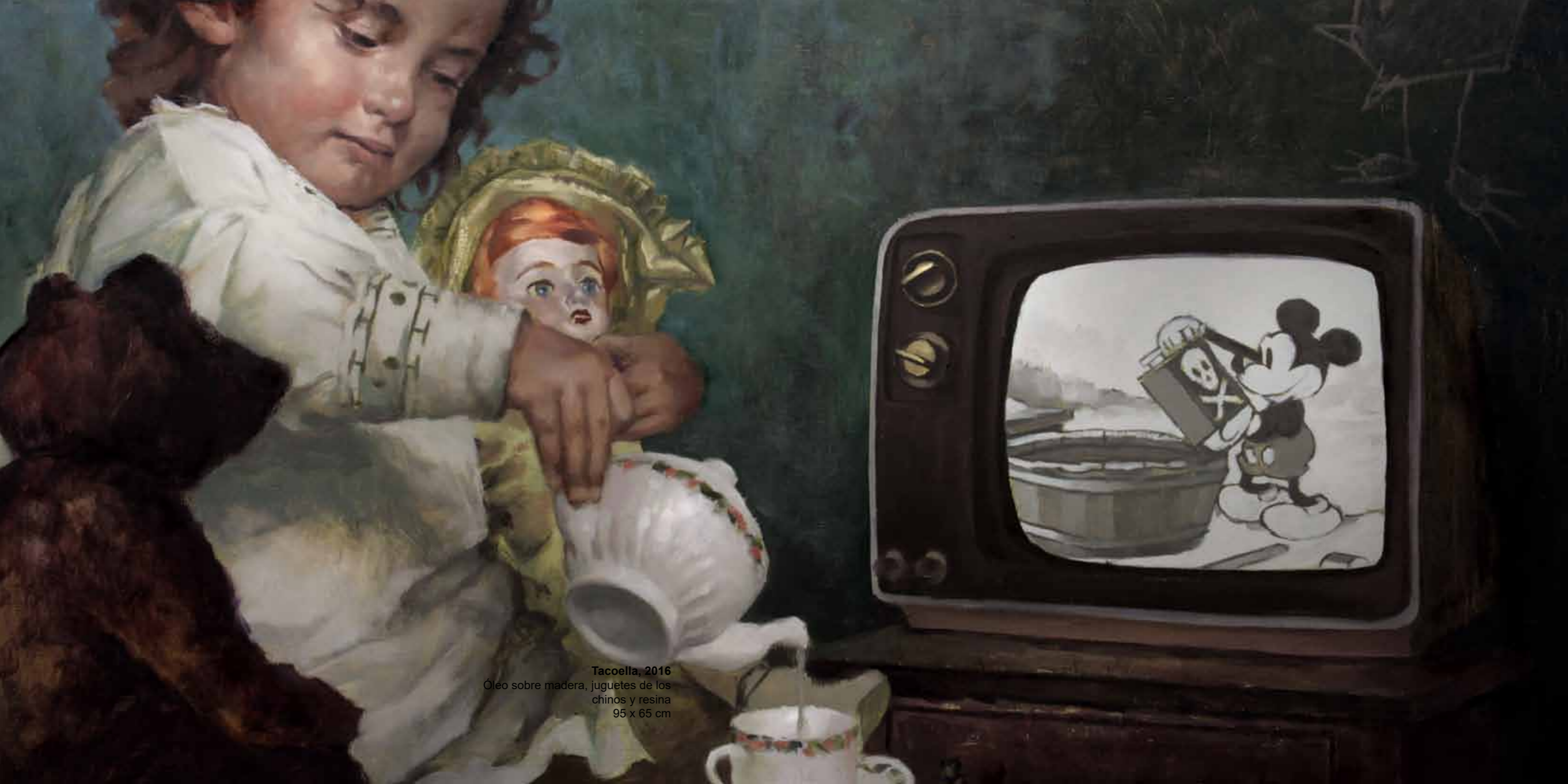
Tacoella, 2016 Óleo sobre madera, juguetes de los chinos y resina 95 x 65 cm