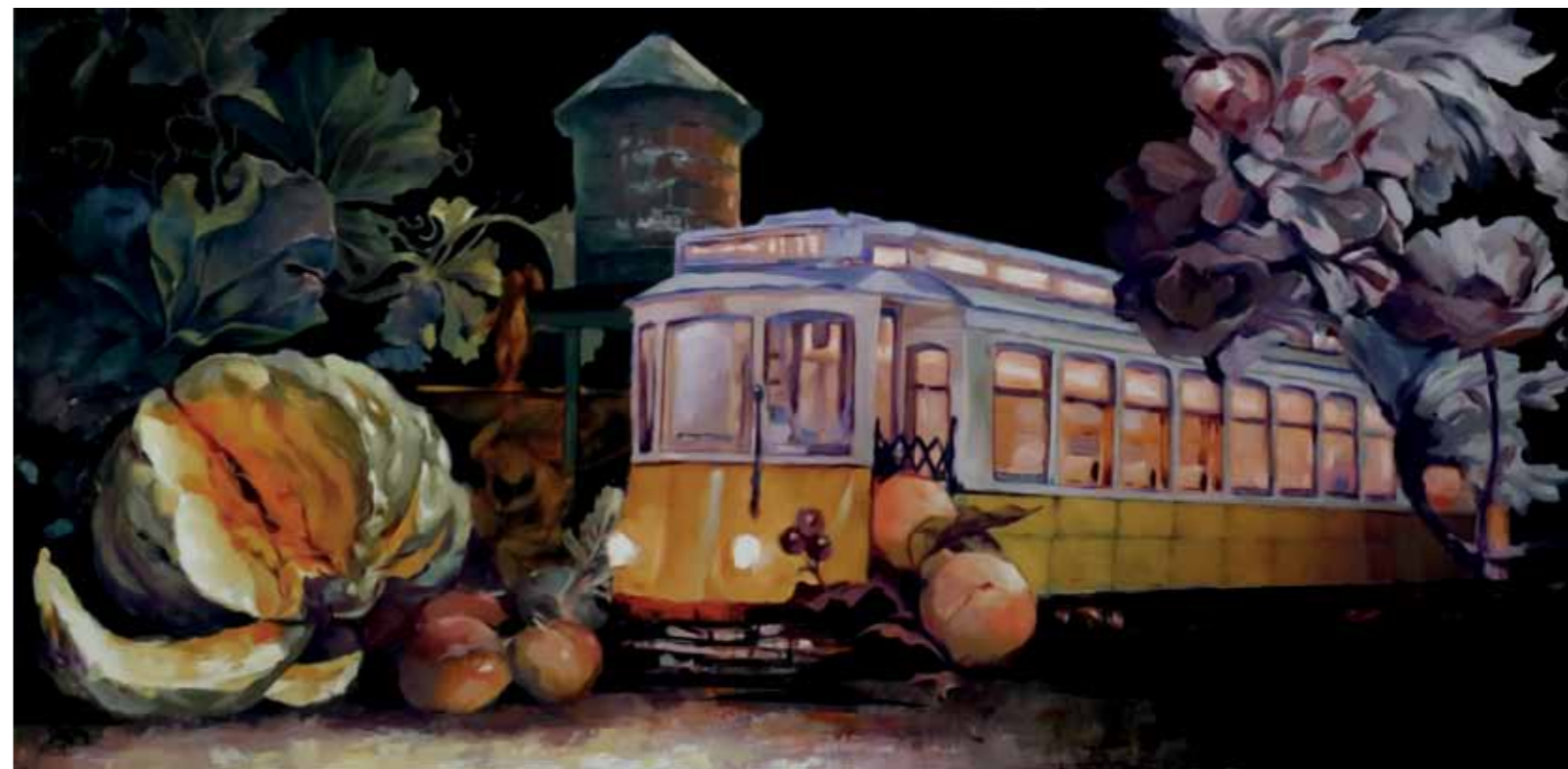
Bodegón Station , 2016 Óleo sobre tela 80 x 40 cm