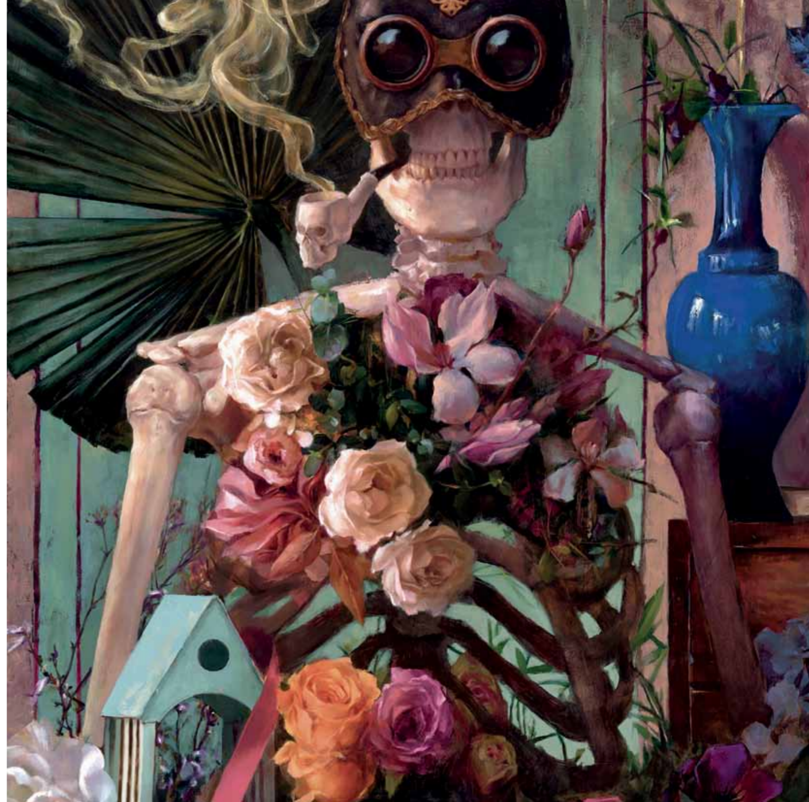
Amapola (detalle), 2015 Óleo sobre tela 100 x 81 cm