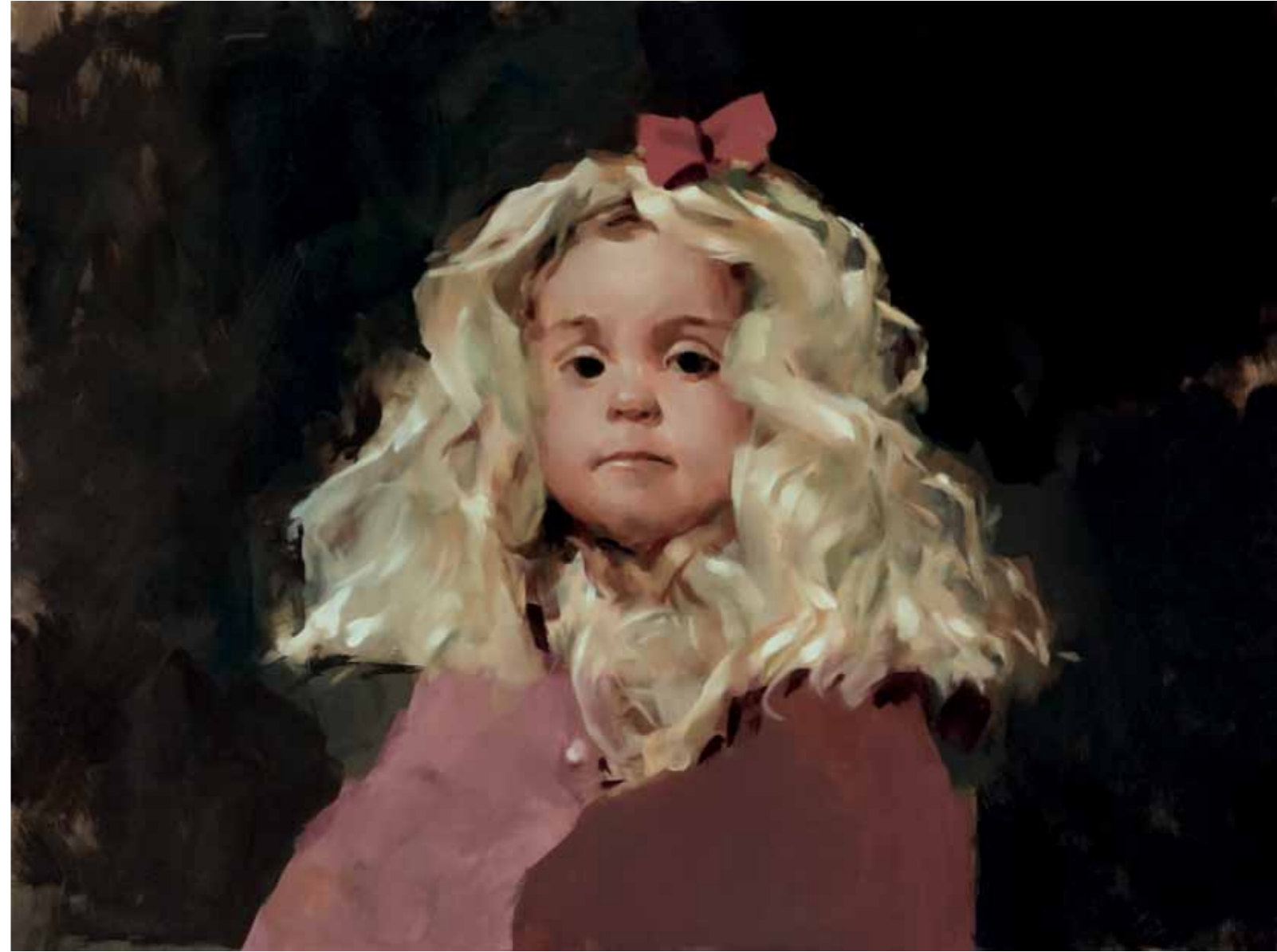
Miniña, 2017 Óleo sobre madera 60 x 45 cm