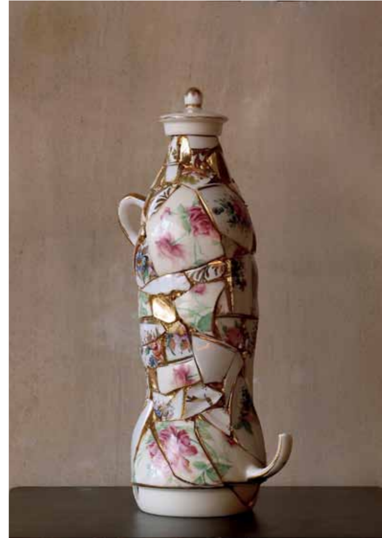
Aspartamo , 2017 Resina y mosaico de cerámica inglesa 25 x 8 x 10 cm. Pieza única