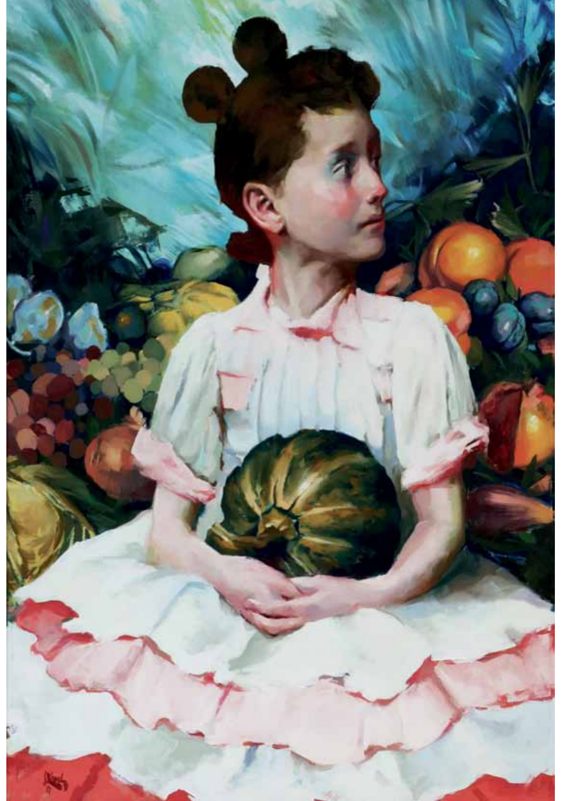
Paraíso , 2016 Óleo sobre tela 81 x 54 cm