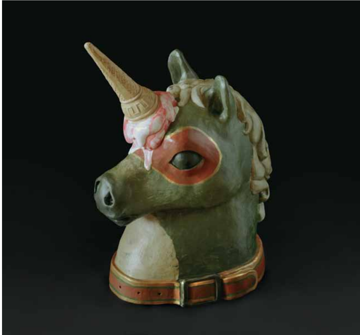
Unicornio, 2017 Resina policromada a mano 33 x 15 x 24 cm Ed. 1/5