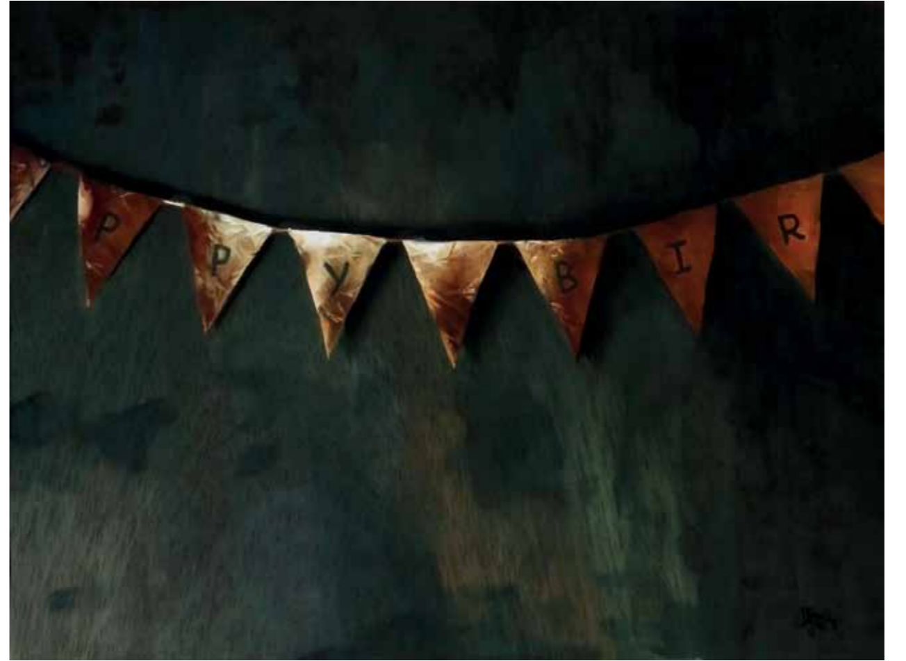
Happy Birthday, 2017 Óleo sobre madeira 60 x 45 cm