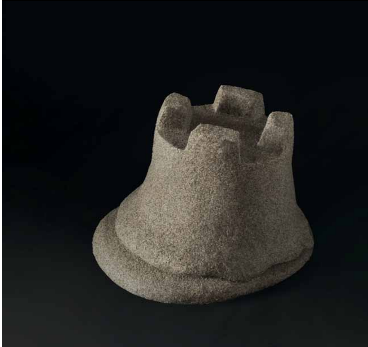
Overdose , 2017 Resina policromada con arena de Sitges 13 x 18 x 18 cm Ed. 1/5