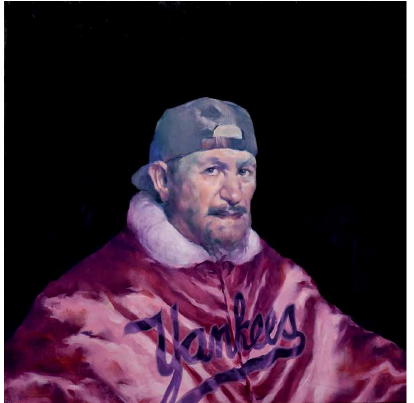
Tropo Vero , 2015 Óleo sobre madeira 65 x 65 cm