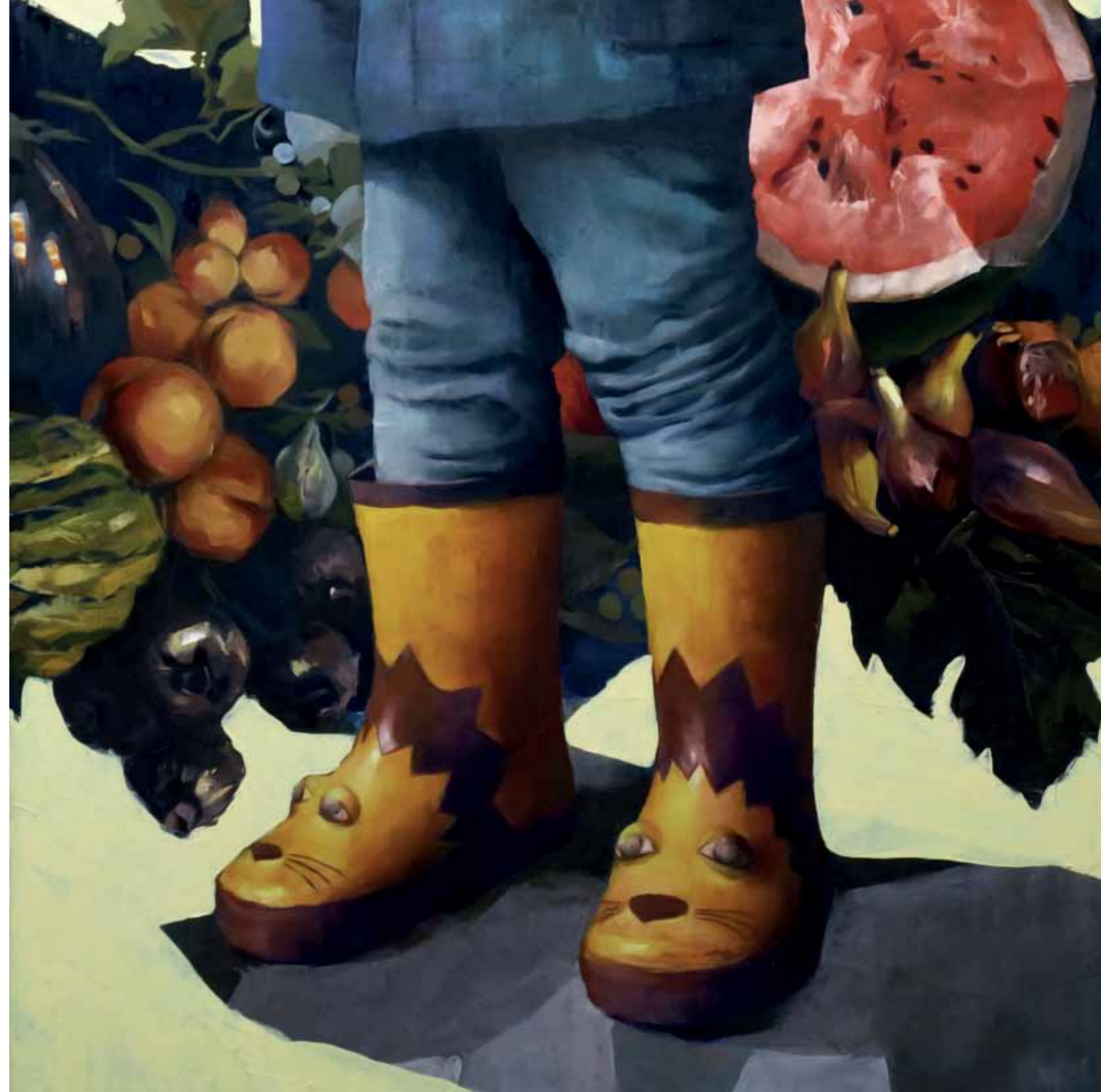
Azul Blue , 2016 Óleo sobre tela 70 x 60 cm