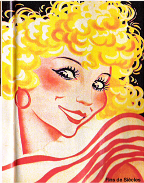
Fins de Sècles