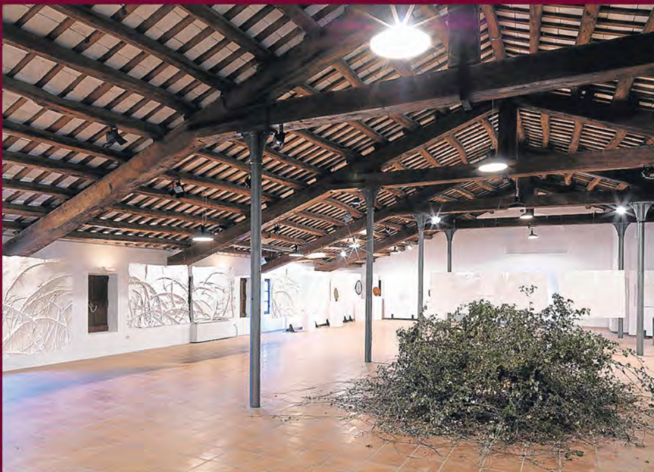
L'esbarzer que persevera