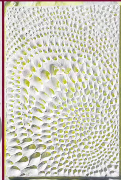
Paper amb forats