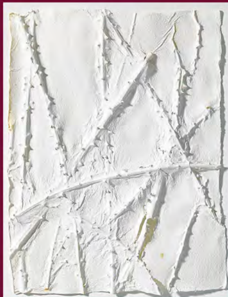
Branques i punxes